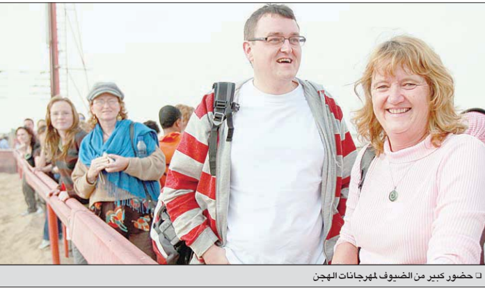
حضور كبير من الضيوف لمهرجانات الهجن